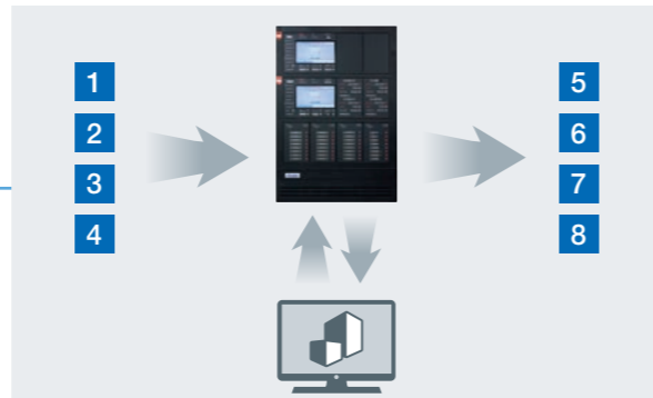
Adressage détection incendie