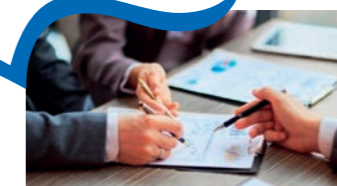
Option d'astreinte 24/24 et intervention sous 2/4 h