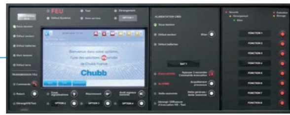
Commandes et signalisations