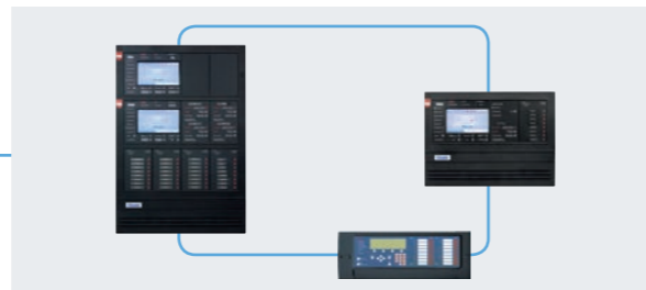
Réseau fibre optique