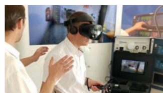
Formation incendie et conseil